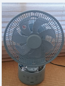
一目ぼれした扇風機

発行 社会医療法人こびし広報委員会 苫小牧市ウトナイ南2丁目1-8 TEL:0144-84-5561 http://www.uenae-hp.or.jp/